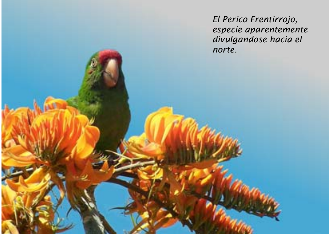
El Perico Frentirrojo, especie aparentemente divulgándose hacia el norte.

Perico Frentirrojo Aratinga finschi : estos registros representan tal vez los más septentrionales, ya que la especie según la literatura no se conoce de Honduras.