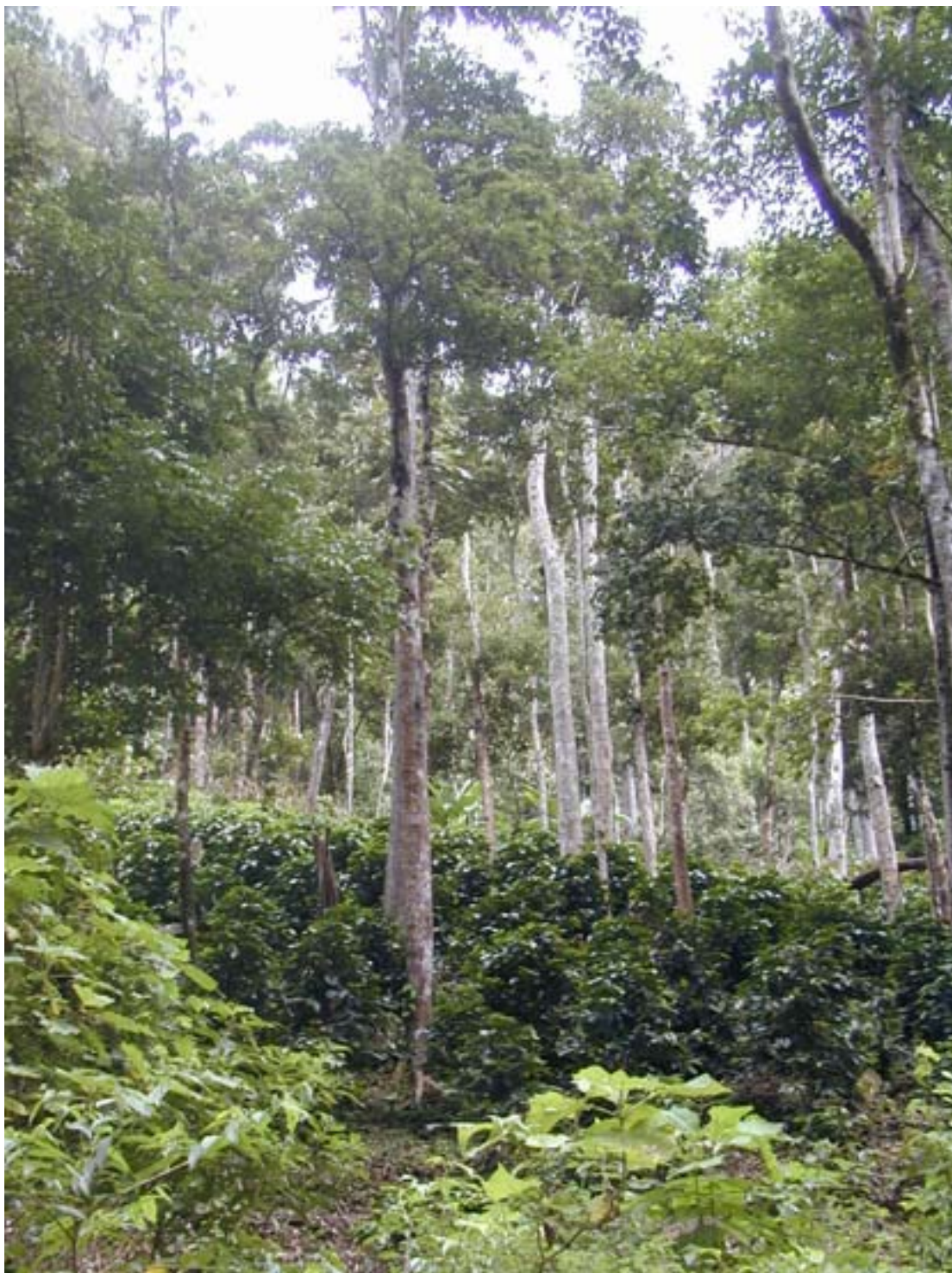
Finca de café con árboles altos en Dipilto.