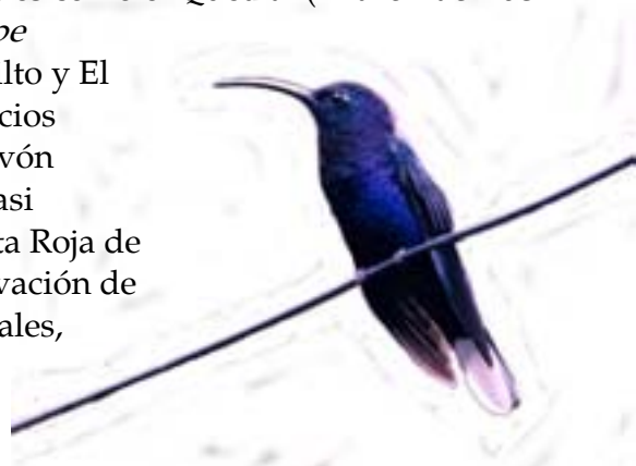
El Sable Violáceo, una de 14 especies de colibríes encontradas durante la investigación.

Los registros también en gran medida carecen de aves nocturnas, por no haber realizado investigaciones de campo durante horas nocturnas.