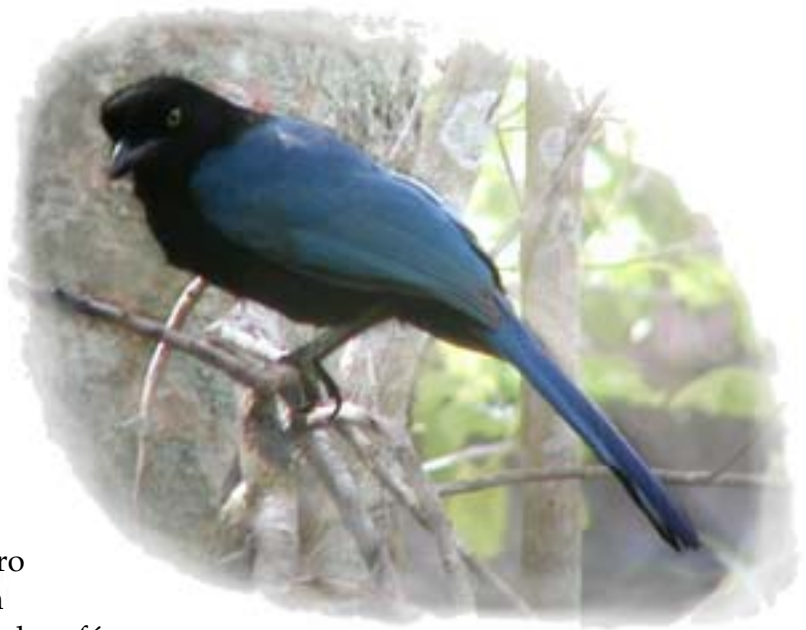
La Urraca Pechinegra, especie típica de tanto El Doradito como Dipilto.

De las 190 especies, 96 fueron registradas dentro de las fincas de café. El hecho de que muchas especies no se hallaron precisamente en los cafetales durante el estudio, no necesariamente implica que no utilizan las fincas de café en cierto momento. La lista total representa aproximadamente el número de especies que en potencia podría frecuentar las fincas de café para su alimentación. Algunas especies solamente se registraron sobrevolando los terrenos, entre ellas diferentes águilas, gavilanes y milanos ( Accipitridae ).