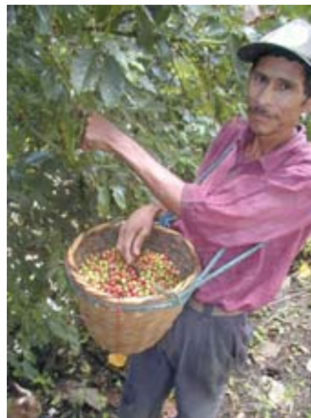
Cortando el café, El Rosario, noviembre 2002.

Las diferentes características de las localidades determinan las diferencias entre la composición de especies – Dipilto casi solamente tiene especies de altura, El Doradito tiene especies de altura mezclado con especies del bosque trópico húmedo, y en El Rosario gran parte de las especies son representantes de la avifauna de la Costa Atlántica. Se estima que estos lugares en conjunto representan gran parte de la diversidad de habitats naturales de las zonas cafetaleras de Nueva Segovia.