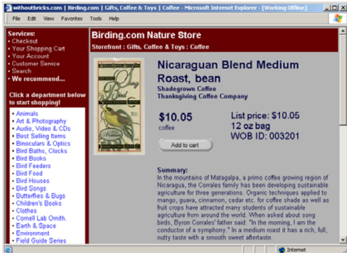
Ejemplo de anuncio en el internet, donde se vende café de sombra de Nicaragua para consumidores principalmente en los Estados Unidos.

Se ha demostrado en otros estudios (en otros países de Latinoamérica) que fincas de café orgánico bajo sombra bien manejadas, contienen una diversidad de aves casi igual a un bosque virgen (entre otros: Wunderle 1998). Como cultivo agrícola, es dudoso que exista otro cultivo como el café bajo sombra, que permite la convivencia de tantas especies silvestres de aves. Los estudios científicos, además de demostrar esa correlación, demuestran la importancia de la composición de especies de árboles de sombra, al igual que la estructura (altura, grado de poda etc.) de la sombra de las fincas.