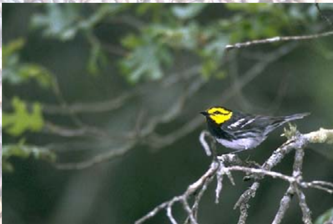
Reinita Pechinegra, especie en peligro de extinción.