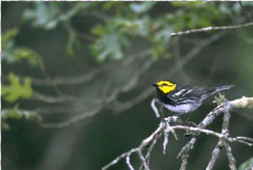
Reinita Pechinegra, especie en peligro de extinción.