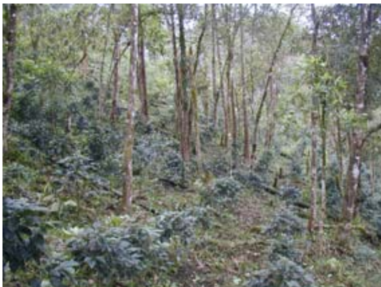
Interior de una finca de café de El Doradito, en una zona alta y bastante húmeda.

Las llanuras del sur de Nicaragua implican una barrera para la divulgación de especies propias de altura, así que para muchas especies esta región de Nicaragua representa su divulgación limítrofe. Esta condición es valedera tanto para especies sedentarias como para especies migratorias.