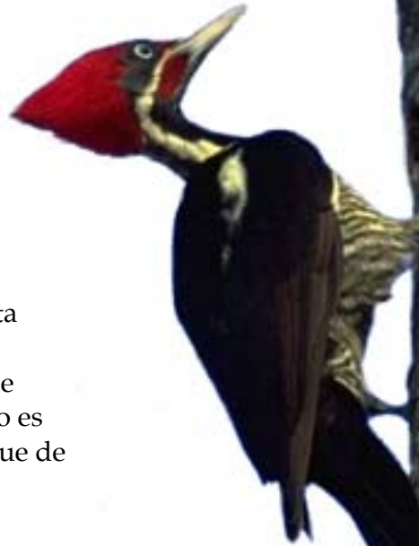
El Carpintero crestirrojo, especie común en toda la zona, incluso se registró nidos dentro de las fincas de café.

zona fronteriza entre Nicaragua y Honduras se encuentra en tierras altas, en el bosque húmedo latifoliado. Requiere grandes espacios de habitat no perturbado para sostener poblaciones viables. Según una estimación de IUCN la población total es de entre 2500 y 10,000 aves. Por eso ha sido declarada especie amenazada a nivel mundial, anotada en la Lista Roja de la IUCN (categoría: vulnerable). Las observaciones de hasta 3 ejemplares en El Doradito es señal de la existencia de un bosque de buena calidad.